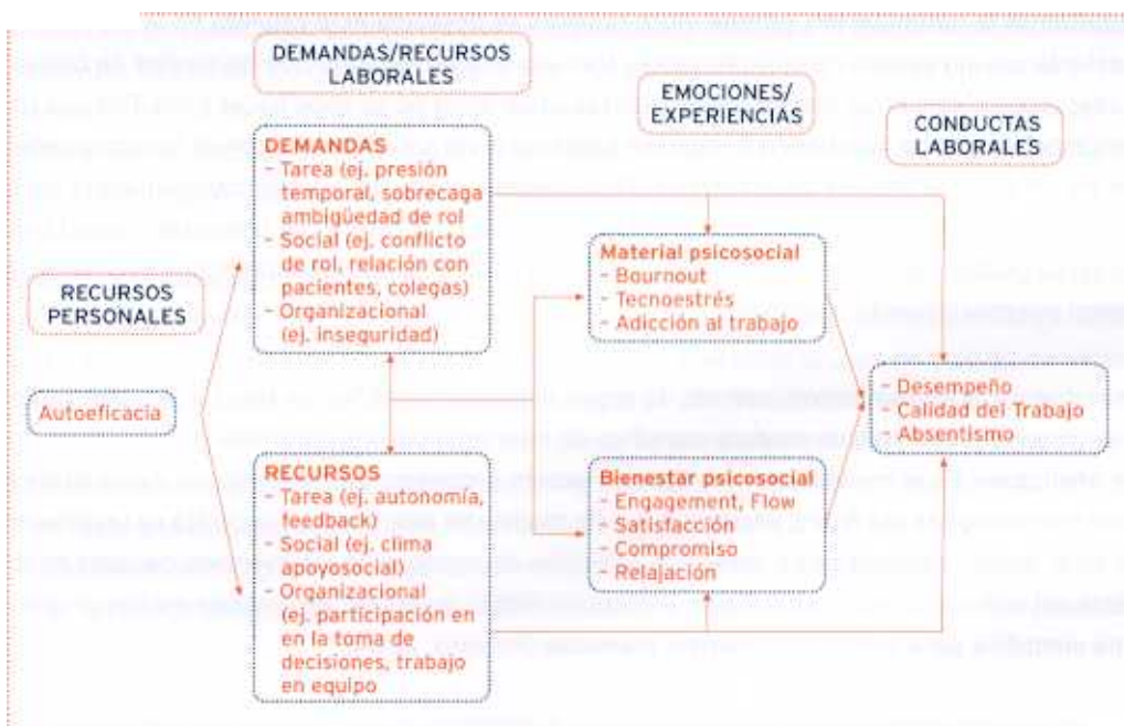
FIGURA 1. Modelo RED (recursos, emociones/experiencias y demandas) en el trabajo

Por lo que se refiere a las Demandas Laborales, a nivel de tarea se distinguen, entre otros, la presión temporal, la sobrecarga cuantitativa y la ambigüedad de rol; a nivel social se destacan el conflicto de rol, y la relación con pacientes/usuarios y colegas. Finalmente, a nivel organizacional se incluye la inseguridad laboral. En cuanto a los Recursos Laborales encontramos también esta diferenciación. Así, a nivel de tareas se destaca la autonomía y el feedback; a nivel social el clima de apoyo social; y a nivel organizacional, la participación en la toma de decisiones y el trabajo en equipo.